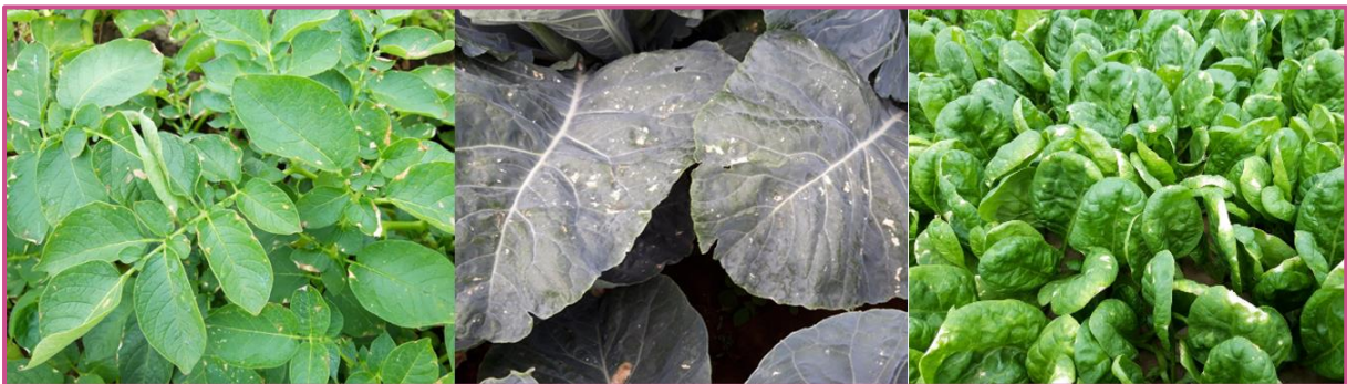
Bladverbranding bij aardappelen, bloemkool en spinazie na irrigatie met gezuiverd afvalwater van de aardappel- en groenteverwerkende sector.

Water met een verhoogde geleidbaarheid ( > 4500 \mu\text{S}/\text{cm} ) kan ook bladverbranding veroorzaken. Dat is negatief voor de kwaliteit van bladgroenten zoals spinazie, maar heeft een verwaarloosbaar effect op knolgewassen zoals aardappelen, en op kolen zoals bloemkool.